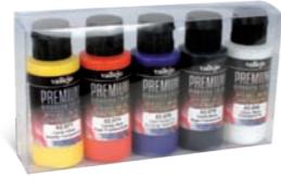
Ref. 62.104 Candy Colors Colores Transparentes

DE AV PREMIUM, spritzfertig die Airbrush angemischt, ist eine vielseitig verwendbare Farbe auf Wasser Base. Die Farben, für alle Oberflächen geeignet, sind giftfrei, nicht toxisch und speziell formuliert für eine hervorragende Haftung auf Metall, GFK, Polyethylen, klare Lexan Polycarbonat, Slot-Car und RC-Karosserien, und alle Tuning -und Auto-Grafik-Anwendungen. Für beste Ergebnisse auf schwierigen Untergründen empfehlen wir zuerst eine Grundschicht mit Polyurethan-Primer (62.061) aufzubringen. Premium-Farben sind flexibel und äußerst langlebig und verblassen auch nach längerer Zeit nicht; die Farben behalten ihre Leuchtkraft und Glanz auch bei Witterungseinflüssen.